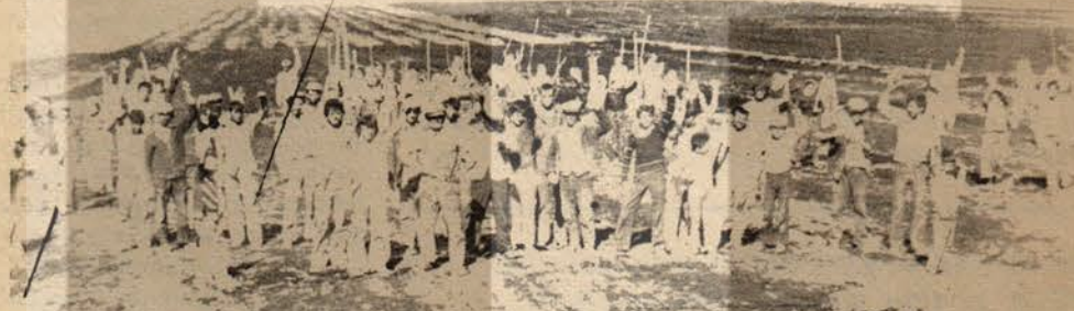
Beylikköprü köylülerinin toprak mücadelesi - Ağustos 75