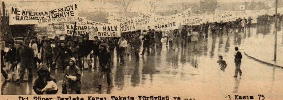
İki Süper Devlete Karşı Taksim Yürüyüşü ve ...