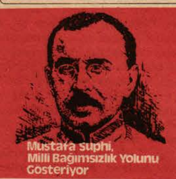
Mustafa Suphi, Milli Bağımsızlık Yolunu Gösteriyor

Bütün ülkelerin işçileri ve ezilen halkları birleşsin!