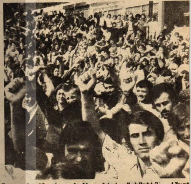
Bereç işçileri ve halk polisi püskürttü - Ağustos

Bütün bu gelişmeler, iki süper devlete karşı dünya birleşik cephesinin güçlenmesinin işaretleri oldu.