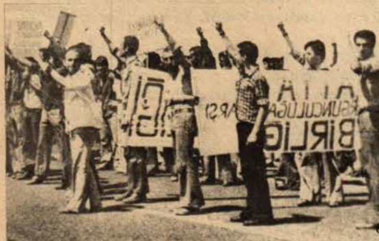
İncirlik Bağımsızlık Yürüyüşü - Ağustos 75