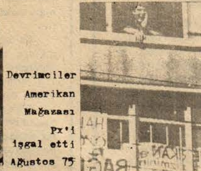
Devrimciler Amerikan Mağazası Pk'1 işgal etti Ağustos 75