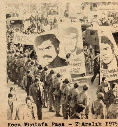
Koca Mustafa Paşa - 2 Aralık 1975