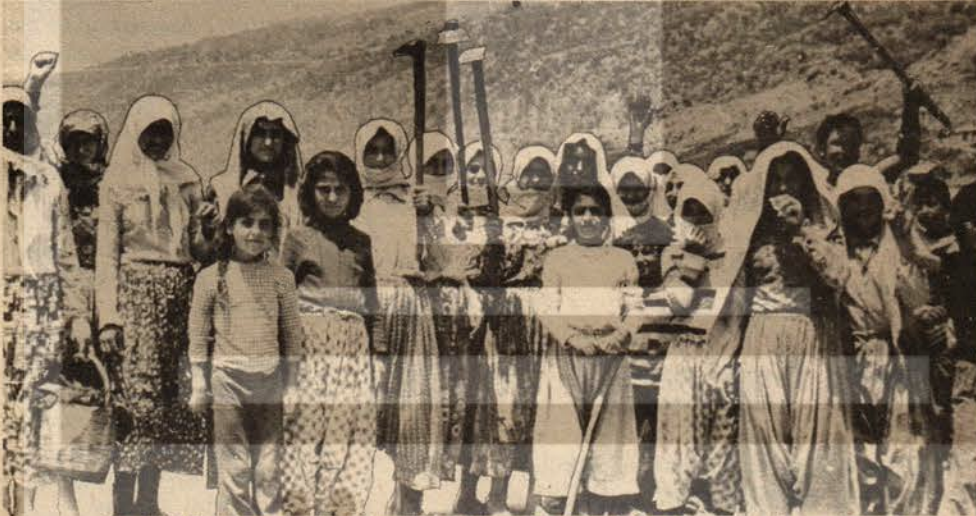
Sazlıköy tarım işçilerinin toprak mücadelesi - Haziran 75