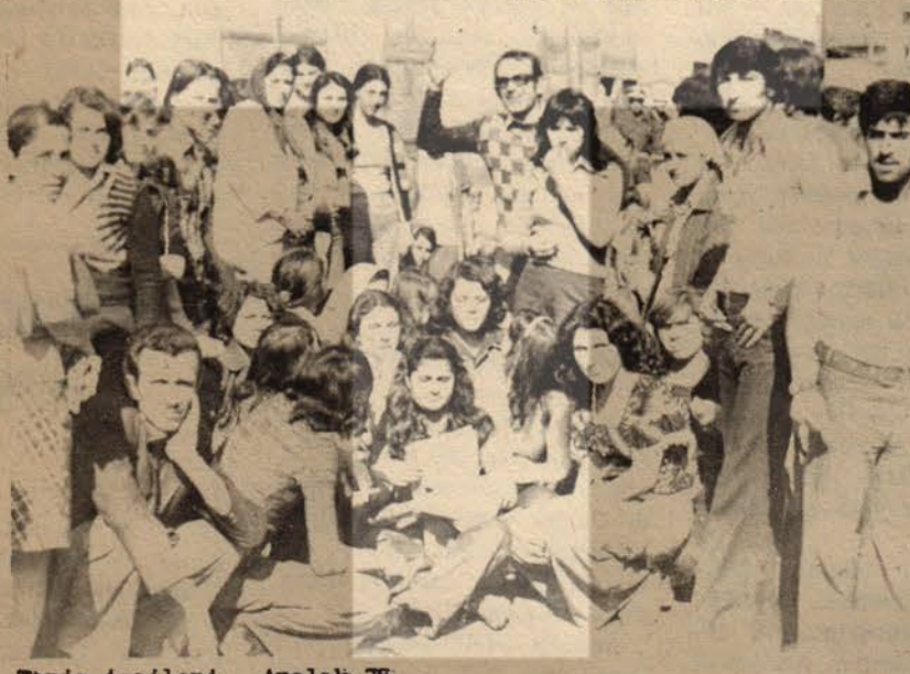
Tariş işçileri - Aralık 75