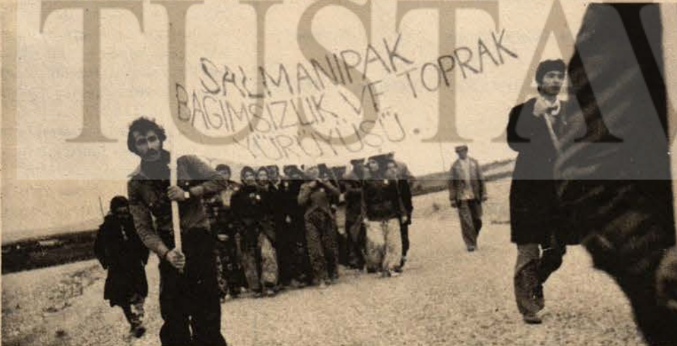
Salmanıpak köylülerinin Toprak ve Bağımsızlık Yürüyüşü - 30 Ekim 1975

ve devrimin esas güçleri olan işçileri ve köylüleri seferber etmeliyiz.